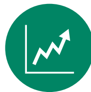
Comerç i màrqueting