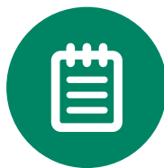
Administració i gestió