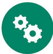
Instal·lació i manteniment