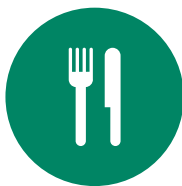
Instal·lació i manteniment