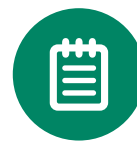
Administració i gestió